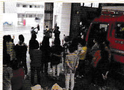
くらしの防災セミナー（防火）