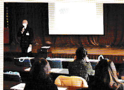
くらしの防災セミナー（防災）